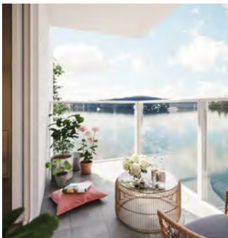
Klassisk fast räcke