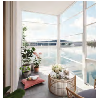
Klassisk höj & sänkbar med överljus