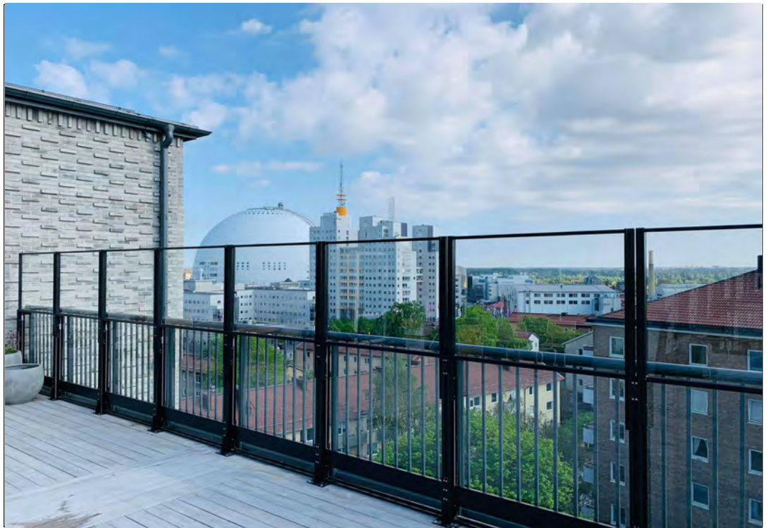
Terrass på tak i Johanneshov