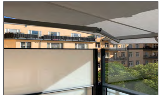
Balkong på Östermalm