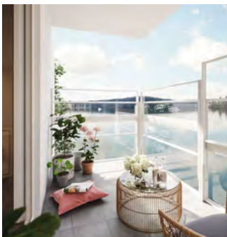
Klassisk Höj & sänkbar