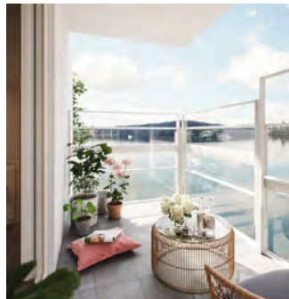
Klassisk Hög & sänkbar