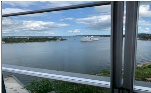
Balkong i Nacka